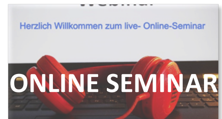
Die drei Online-Angebote von EQASce, TiGA und GenoAkademie.